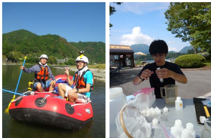
河川・湖での調査