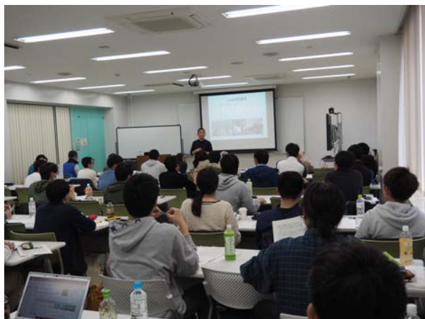
4大学の大学院生が集まり講義を受講