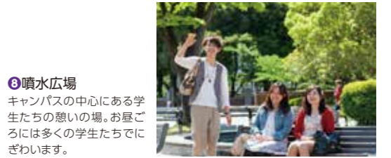
⑧噴水広場 キャンパスの中心にある学生たちの憩いの場。お昼ごろには多くの学生たちでにぎわいます。