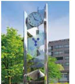
⑥時計塔 甲府東キャンパスのシンボルとしてそびえる時計塔です。