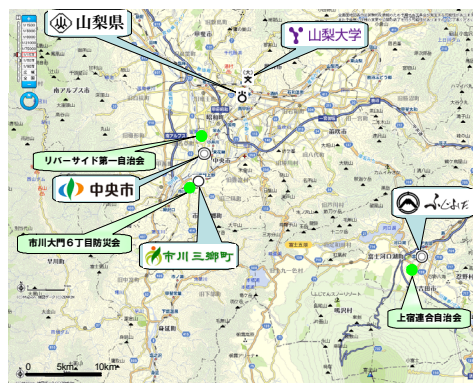
(b) 地域コミュニティ，県市町の庁舎，山梨大学の立地場所