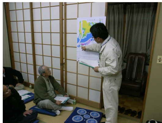
図 3 市防災担当職員によるハザードマップの説明

域の実情にあった減災体制を構築することを目的としている。そのため、住民自身が災害に対する知識や関心を持つと同時に、自分たちの地域でどういった災害の被害が想定されているのか、どういった対策がとられているのか、行政のできることで、できないこと等を、住民と行政の間で相互に理解し共有しておくこと、すなわちリスクコミュニケーションを実施する。従って、防災説明会による防災意識の醸成、想定される災害の被害や地域の課題の理解、ワークショップによる問題点の抽出と解決策の検討、防災訓練による検証というリスクコミュニケーションを通じた PDCA サイクル 4) を基本的なフレームとする。