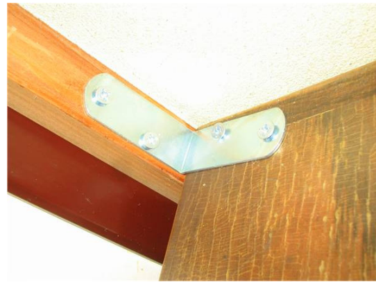
(b) L字金具による固定