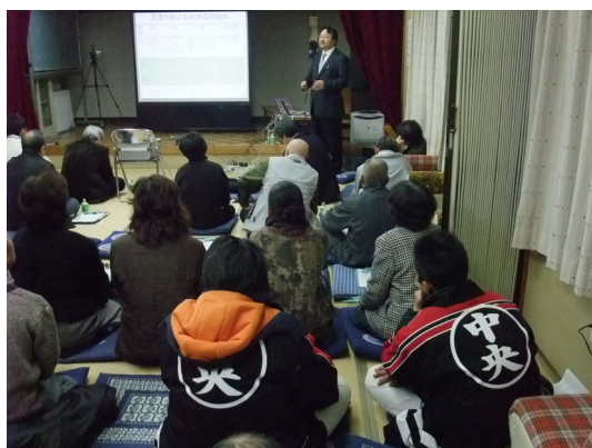
図 2 防災説明会の開催の様子