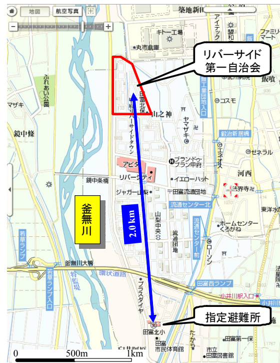
図4 中央市地域コミュニティの周辺地図