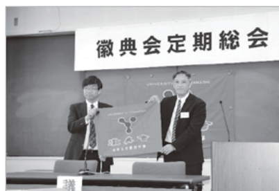
R7. 4. 26 実行委員長の引継

実行委員、同級会の対象は平成8年卒業の皆さんです。実施要項は令和8年3月中旬までにホームページでお知らせします。同級会の案内は1か月前までに葉書でお知らせします。